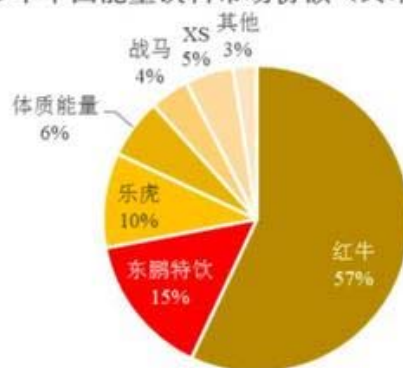
2019年中国能量饮料市场份额（终端销售金额）